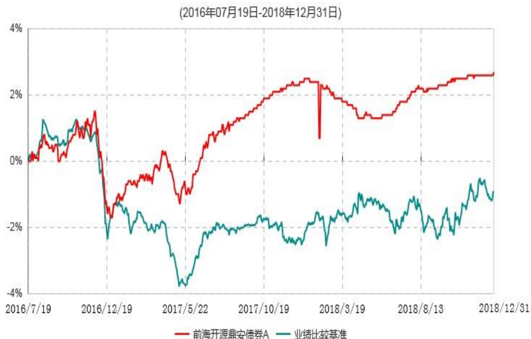
前海开源鼎安债券A累计净值增长率与业绩比较基准收益率历史走势对比图