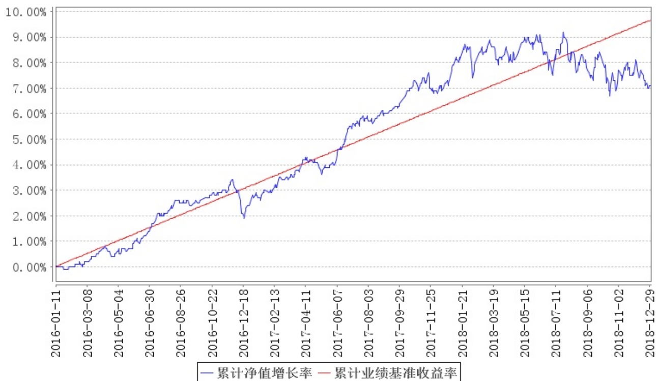
南方益和混合累计净值增长率与同期业绩比较基准收益率的历史走势对比图

注： 1、本基金的建仓期为六个月，建仓结束时各项资产配置比例符合合同约定。 2、本基金的第一个保本期为三年，自 2016 年 1 月 11 日至 2019 年 1 月 11 日止。