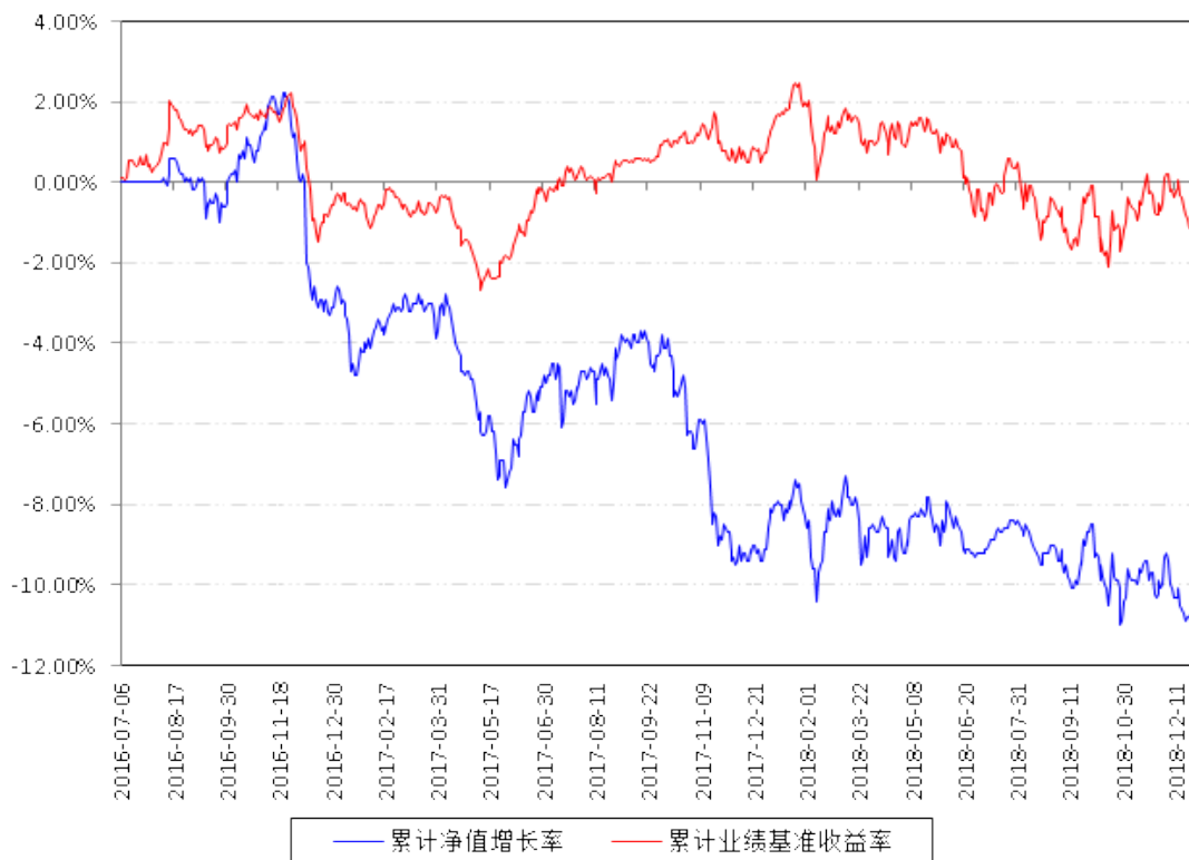
南方甌智定期开放混合型发起式累计净值增长率与同期业绩比较基准收益率的历史走势对比图