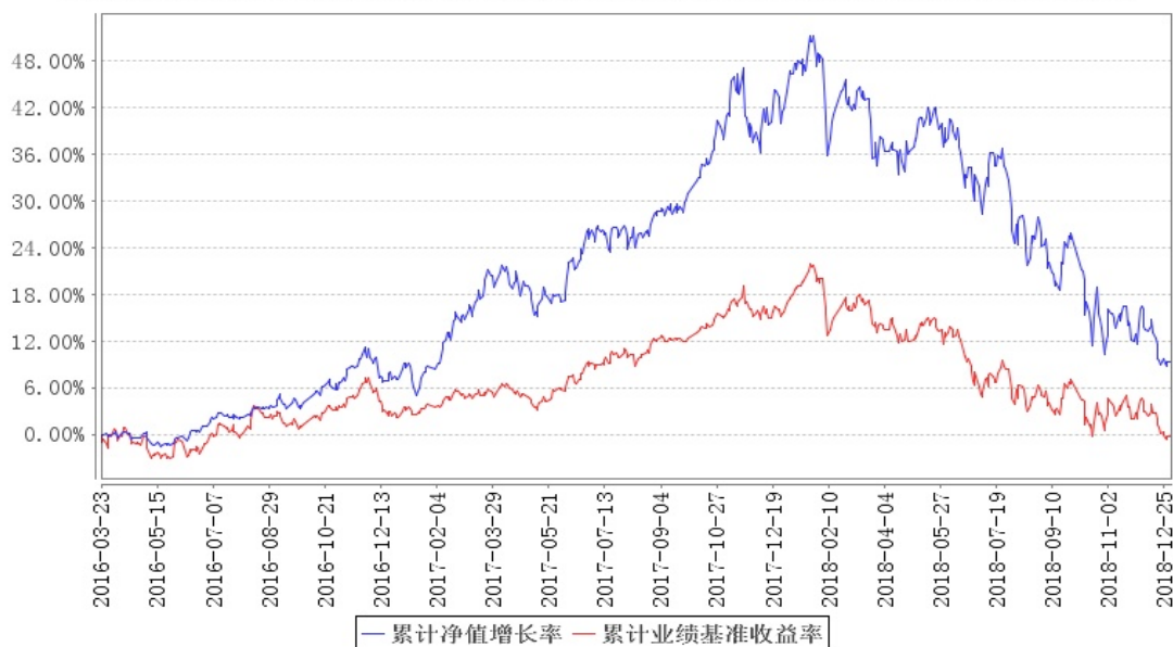
南方驱动混合累计净值增长率与同期业绩比较基准收益率的历史走势对比图