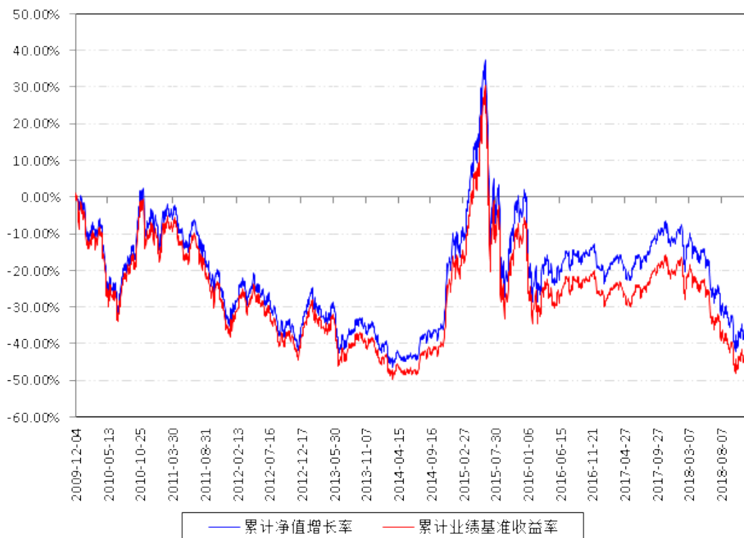
南方深证成份ETF 累计净值增长率与同期业绩比较基准收益率的历史走势对比图