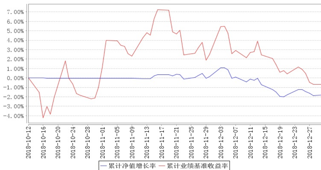
南方人工智能主题混合累计净值增长率与同期业绩比较基准收益率的历史走势对比图

注:本基金合同于 2018 年 10 月 12 日生效,截至本报告期末基金成立未满一年。