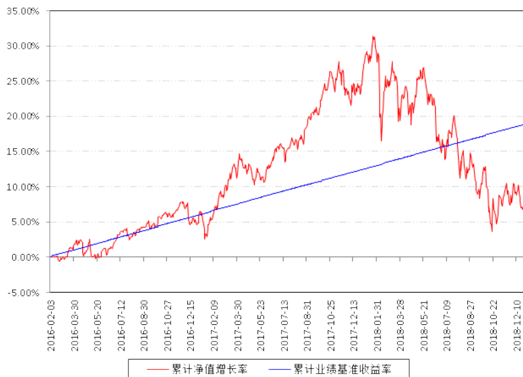
南方君选灵活配置混合累计净值增长率与同期业绩比较基准收益率的历史走势对比图