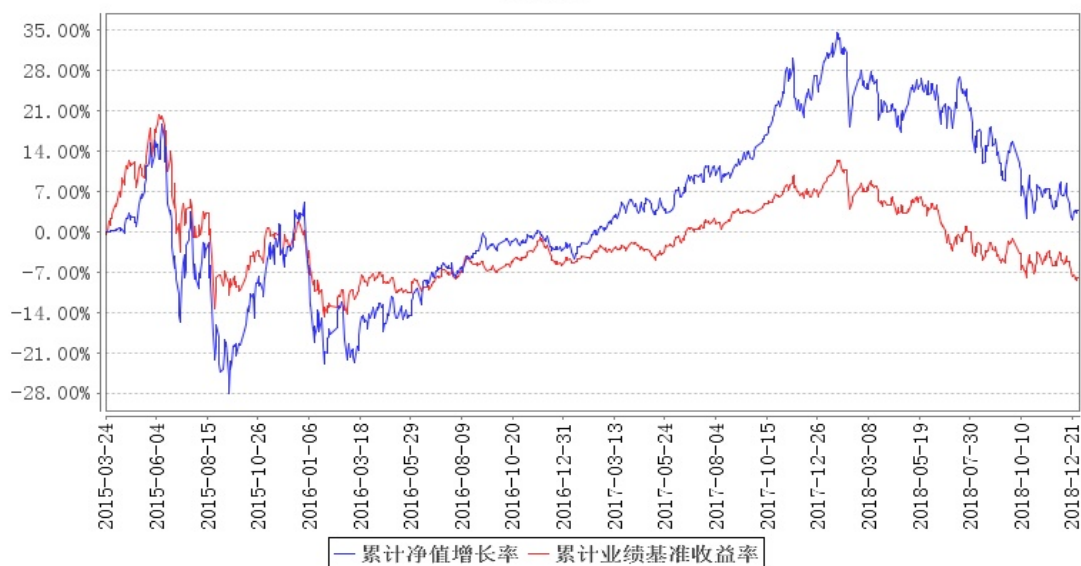
南方创新经济灵活配置混合累计净值增长率与同期业绩比较基准收益率的历史走势对比图