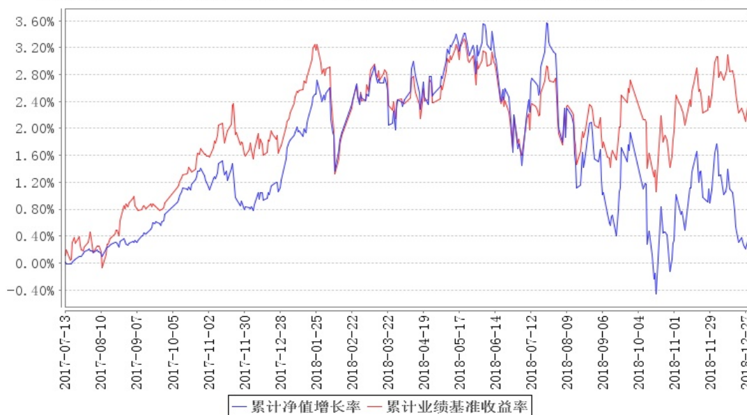
南方安睿混合累计净值增长率与同期业绩比较基准收益率的历史走势对比图

注:本基金的基金合同生效日为 2017 年 7 月 13 日,本基金建仓期为 6 个月,建仓期结束时各项资产配置比例符合合同约定。