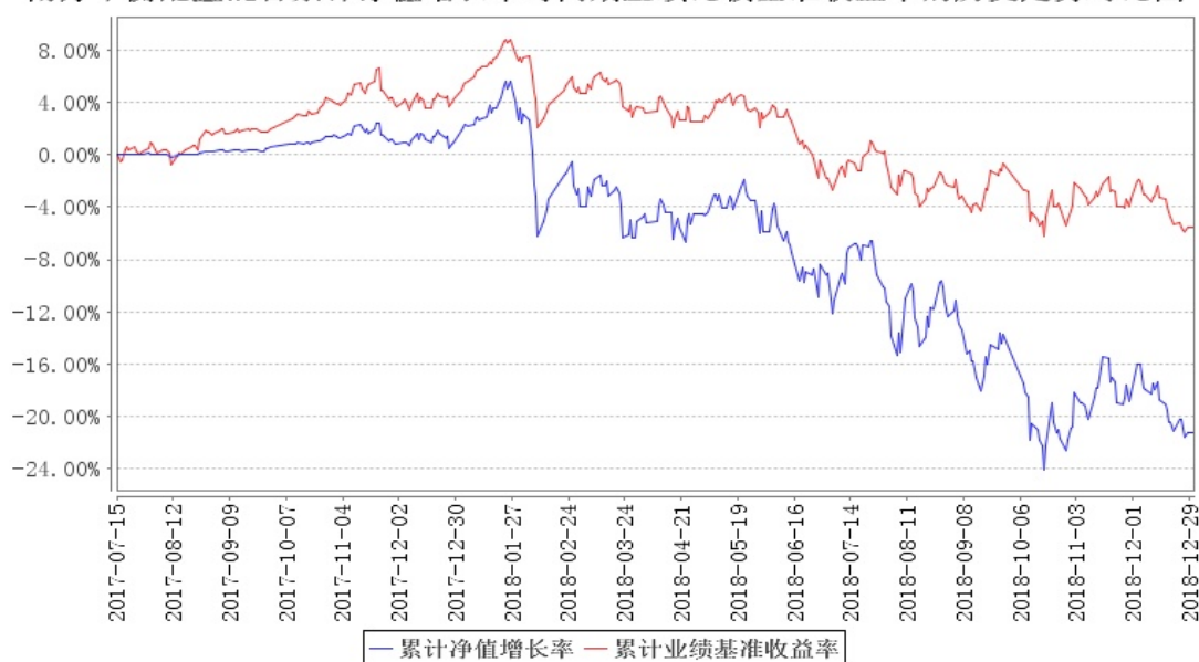
南方平衡配置混合累计净值增长率与同期业绩比较基准收益率的历史走势对比图