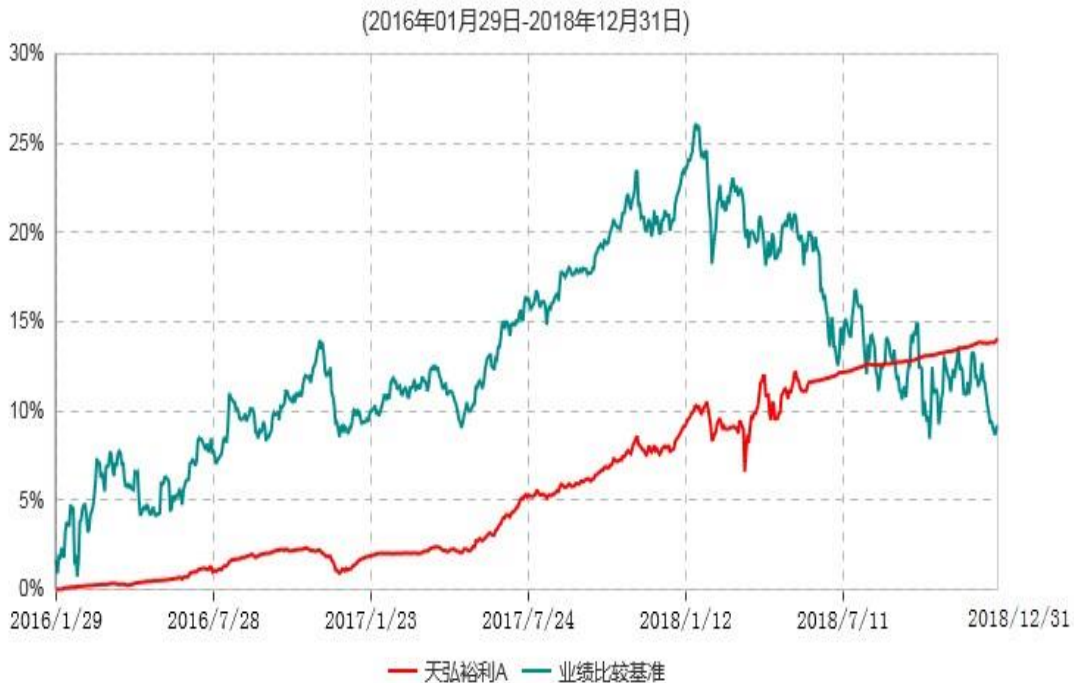
天弘裕利A累计净值增长率与业绩比较基准收益率历史走势对比图