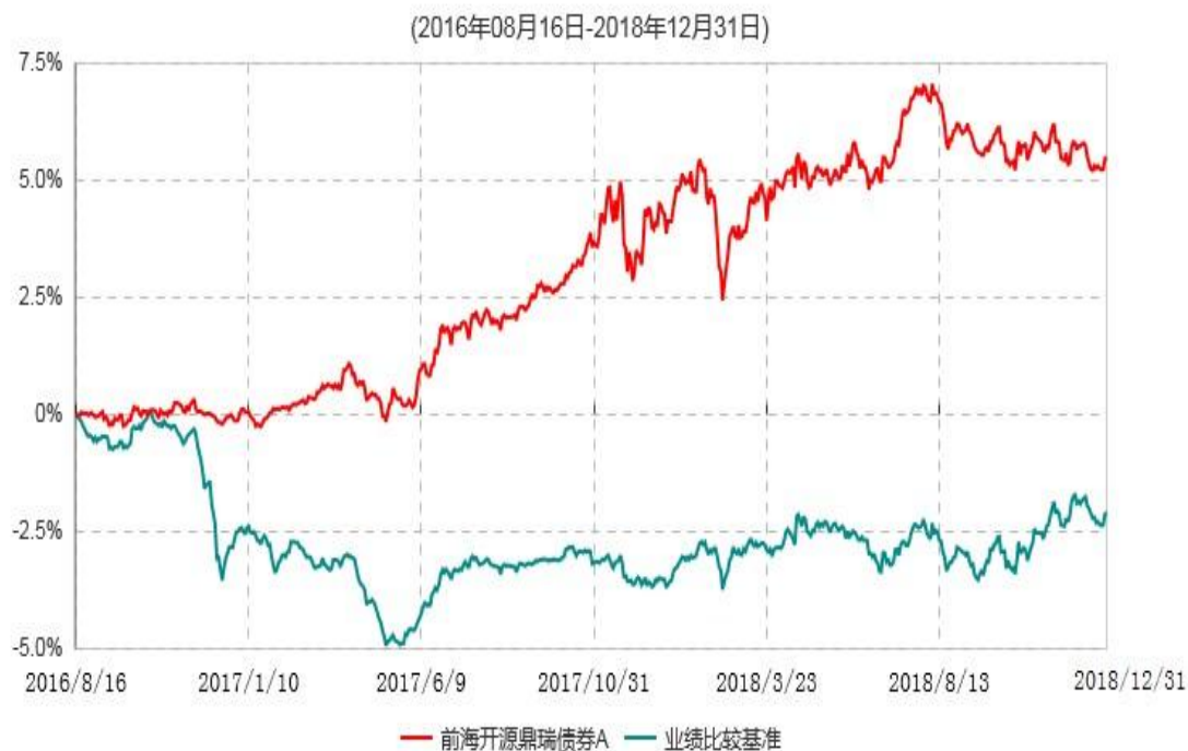
前海开源鼎瑞债券A累计净值增长率与业绩比较基准收益率历史走势对比图