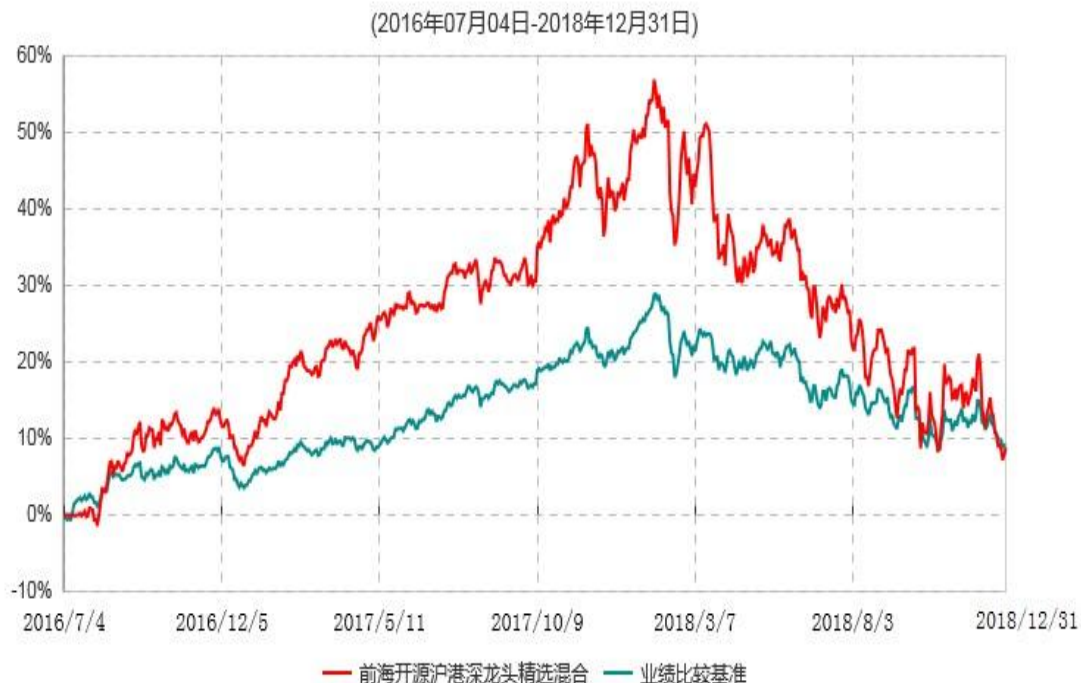
前海开源沪港深龙头精选灵活配置混合型证券投资基金累计净值增长率与业绩比较基准收益率历史走势对比图