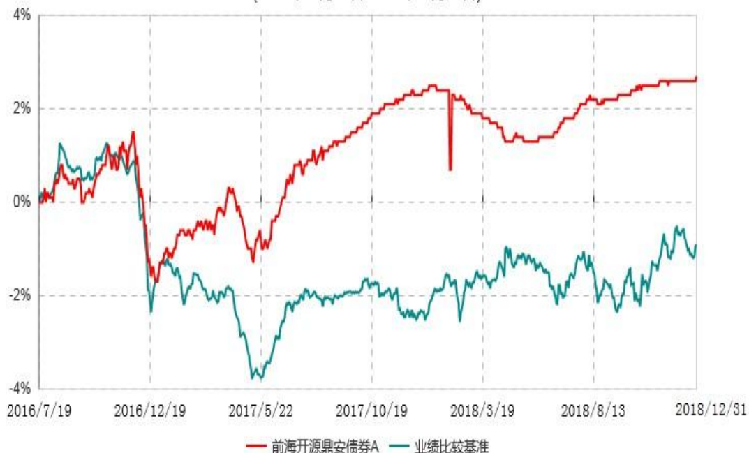
前海开源鼎安债券C累计净值增长率与业绩比较基准收益率历史走势对比图