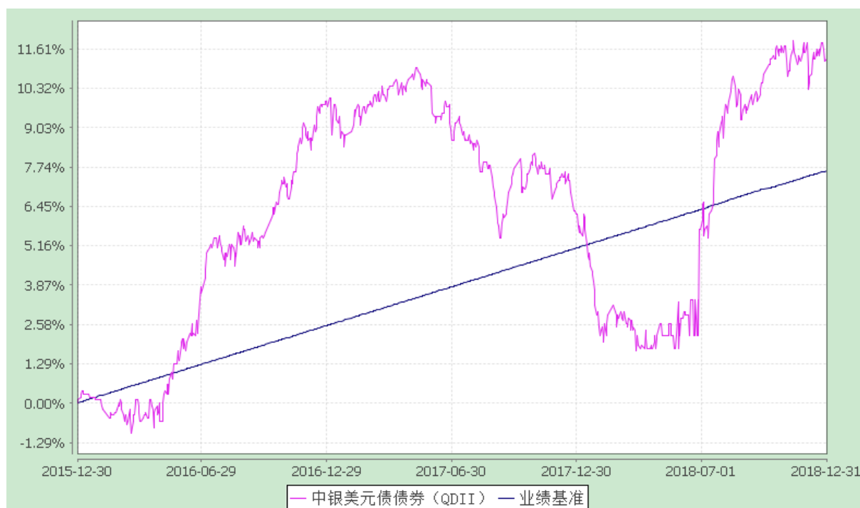
中银美元债债券型证券投资基金（QDII） 自基金合同生效以来份额累计净值增长率与业绩比较基准收益率历史走势对比图 (2015 年 12 月 30 日至 2018 年 12 月 31 日)