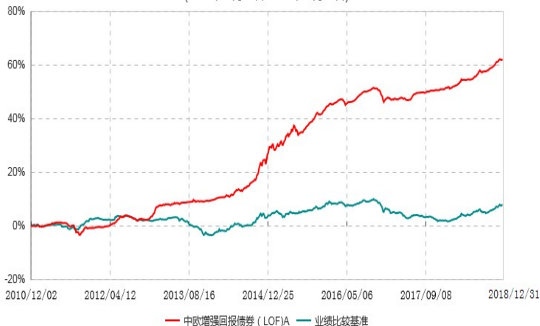
中欧增强回报债券（LOF）E累计净值增长率与业绩比较基准收益率历史走势对比图