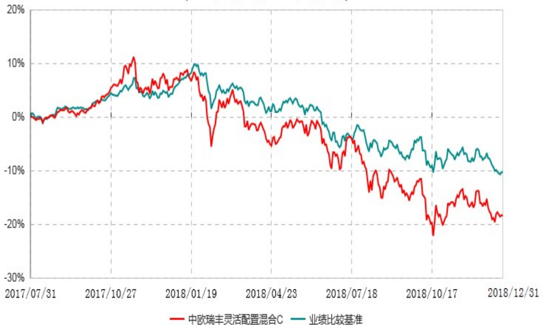
中欧瑞丰灵活配置混合C累计净值增长率与业绩比较基准收益率历史走势对比图 (2017年07月31日-2018年12月31日)

注：本基金合同生效日期为 2017 年 7 月 31 日，按基金合同的规定，本基金自基金合同生效起六个月为建仓期，建仓期结束时本基金的各项资产配置比例已达到基金合同约定。