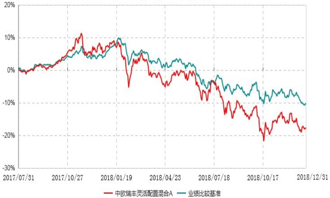
中欧瑞丰灵活配置混合A累计净值增长率与业绩比较基准收益率历史走势对比图 (2017年07月31日-2018年12月31日)

注：本基金合同生效日期为 2017 年 7 月 31 日，按基金合同的规定，本基金自基金合同生效起六个月为建仓期，建仓期结束时本基金的各项资产配置比例已达到基金合同约定。