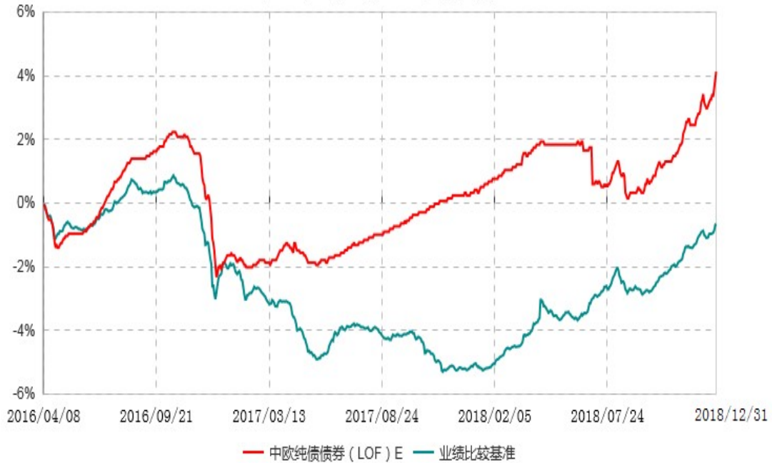
中欧纯债债券(LOF)E累计净值增长率与业绩比较基准收益率历史走势对比图 (2016年04月08日-2018年12月31日)

注：自 2016 年 4 月 6 日起，本基金新增 E 类份额，图示日期为 2016 年 04 月 08 日至 2018 年 12 月 31 日。