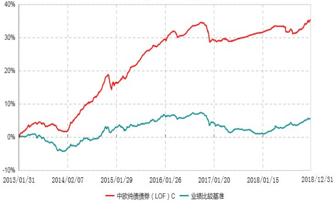
中欧纯债债券(LOF)C累计净值增长率与业绩比较基准收益率历史走势对比图 (2013年01月31日-2018年12月31日)