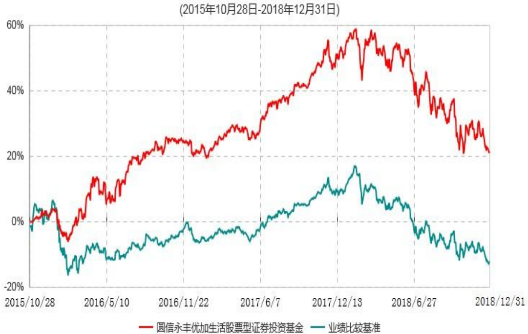
圆信永丰优加生活股票型证券投资基金累计净值增长率与业绩比较基准收益率历史走势对比图