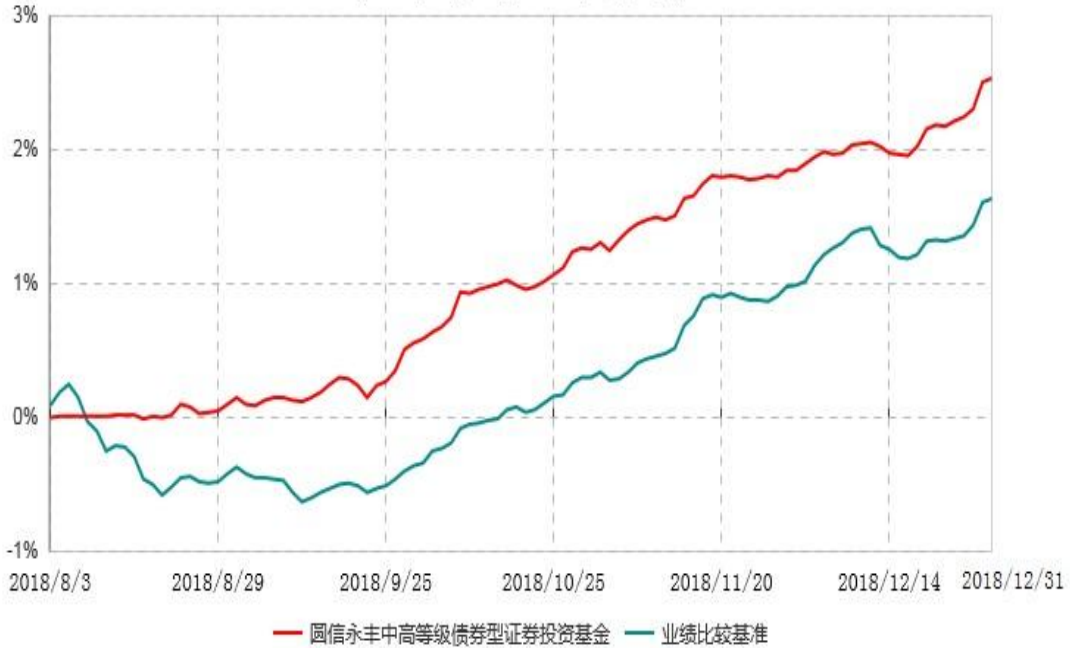
圆信永丰中高等级债券型证券投资基金累计净值增长率与业绩比较基准收益率历史走势对比图 (2018年08月03日-2018年12月31日)