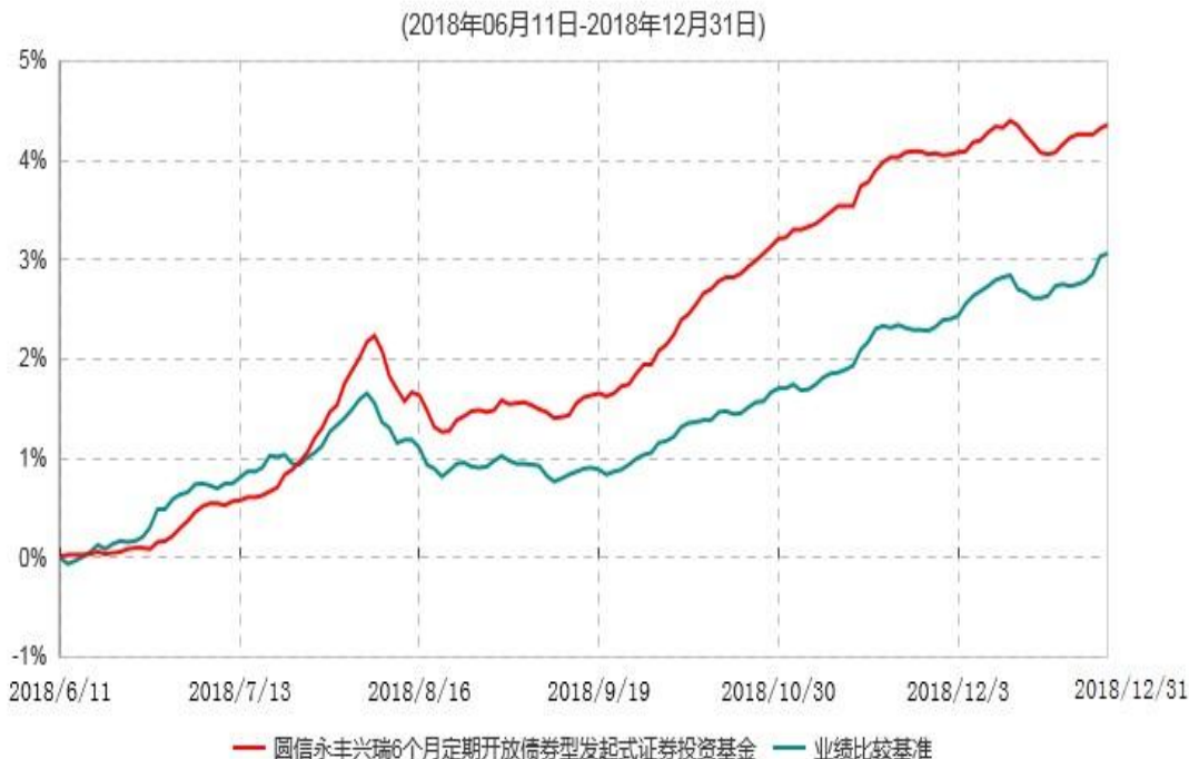
圆信永丰兴瑞6个月定期开放债券型发起式证券投资基金累计净值增长率与业绩比较基准收益率历史走势对比图

注：自基金合同生效后，截止报告期末，本基金成立不满一年；本基金已完成建仓但报告期末距建仓结束不满一年，建仓结束时各项资产配置比例符合合同约定。