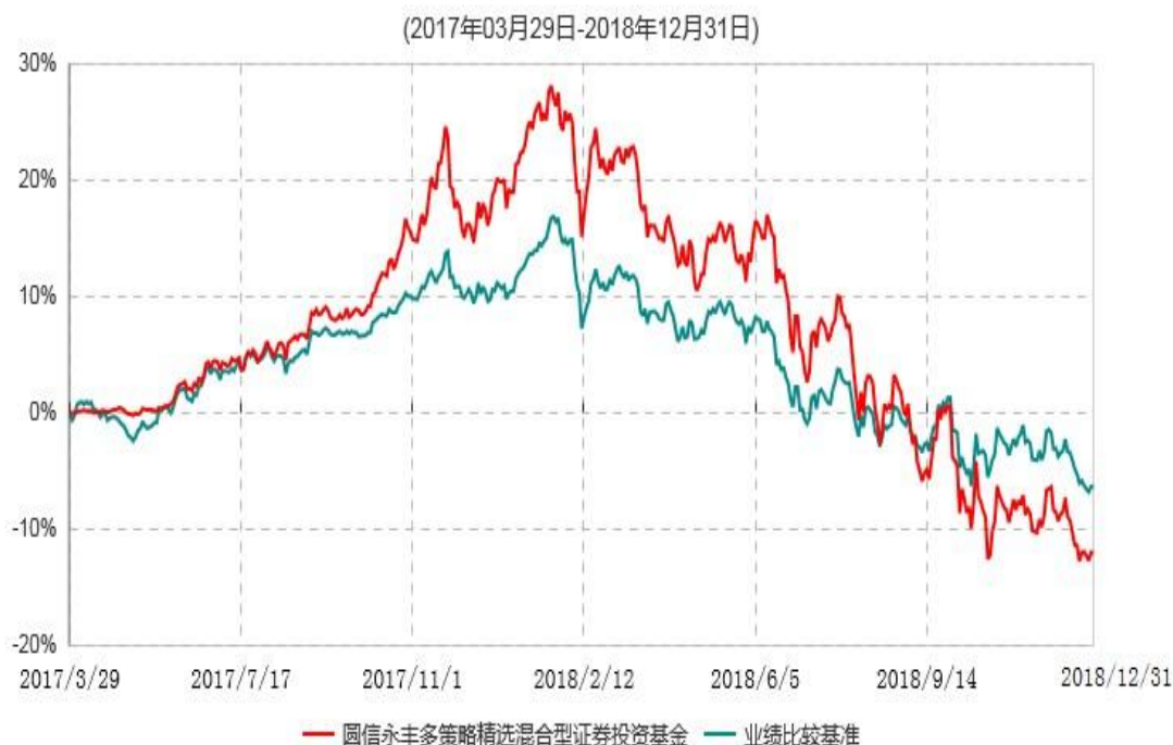
圆信永丰多策略精选混合型证券投资基金累计净值增长率与业绩比较基准收益率历史走势对比图