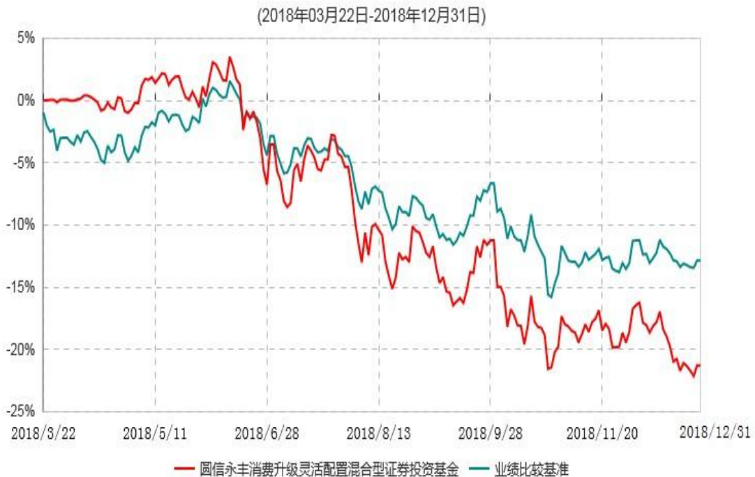
圆信永丰消费升级灵活配置混合型证券投资基金累计净值增长率与业绩比较基准收益率历史走势对比图

注：自基金合同生效后，截止报告期末，本基金成立不满一年。截止报告期末，本基金已完成建仓但报告期末距建仓结束不满一年，建仓期结束时各项资产配置比例符合合同约定。