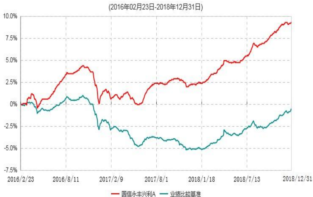
圆信永丰兴利A累计净值增长率与业绩比较基准收益率历史走势对比图