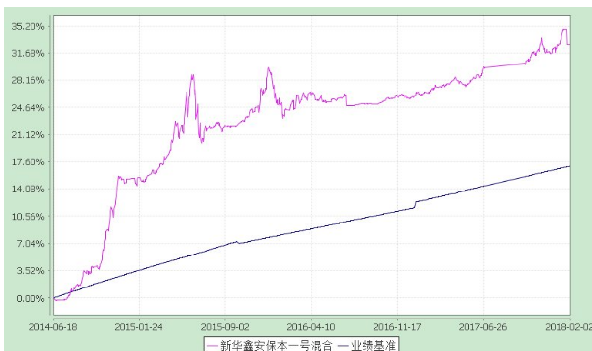
新华鑫安保本一号混合型证券投资基金 份额累计净值增长率与业绩比较基准收益率的历史走势对比图 (2014 年 6 月 18 日至 2018 年 2 月 2 日)