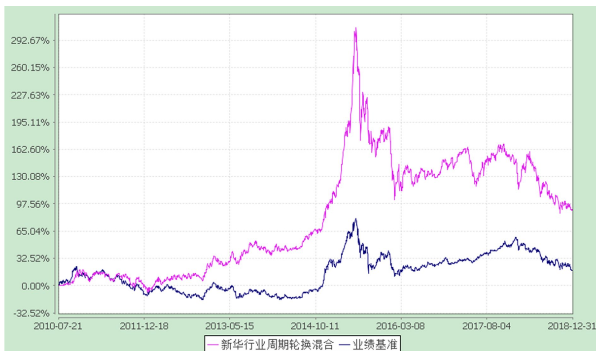
新华行业周期轮换混合型证券投资基金 份额累计净值增长率与业绩比较基准收益率的历史走势对比图 (2010 年 7 月 21 日至 2018 年 12 月 31 日)