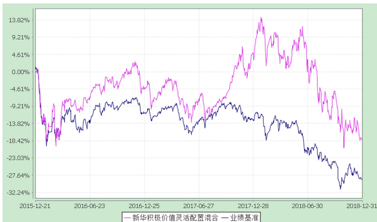
新华积极价值灵活配置混合型证券投资基金 份额累计净值增长率与业绩比较基准收益率的历史走势对比图 (2015 年 12 月 21 日至 2018 年 12 月 31 日)