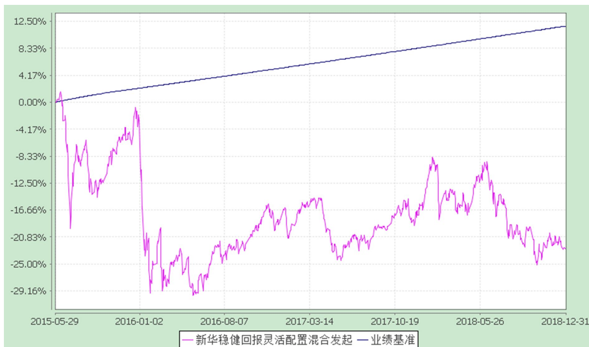
新华稳健回报灵活配置混合型发起式证券投资基金 份额累计净值增长率与业绩比较基准收益率的历史走势对比图 (2015 年 5 月 29 日至 2018 年 12 月 31 日)