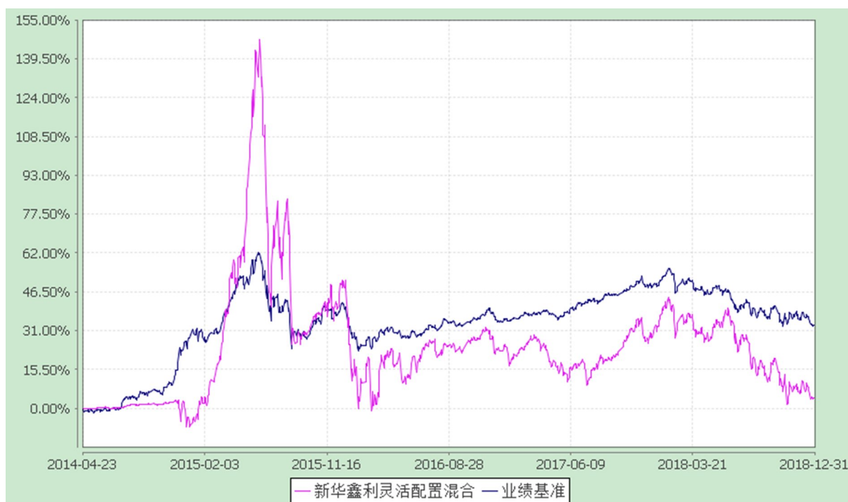
新华鑫利灵活配置混合型证券投资基金 份额累计净值增长率与业绩比较基准收益率的历史走势对比图 (2014 年 4 月 23 日至 2018 年 12 月 31 日)