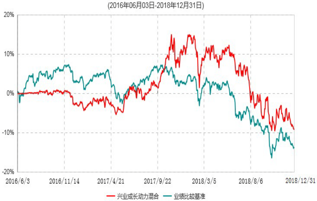
兴业成长动力灵活配置混合型证券投资基金累计净值增长率与业绩比较基准收益率历史走势对比图