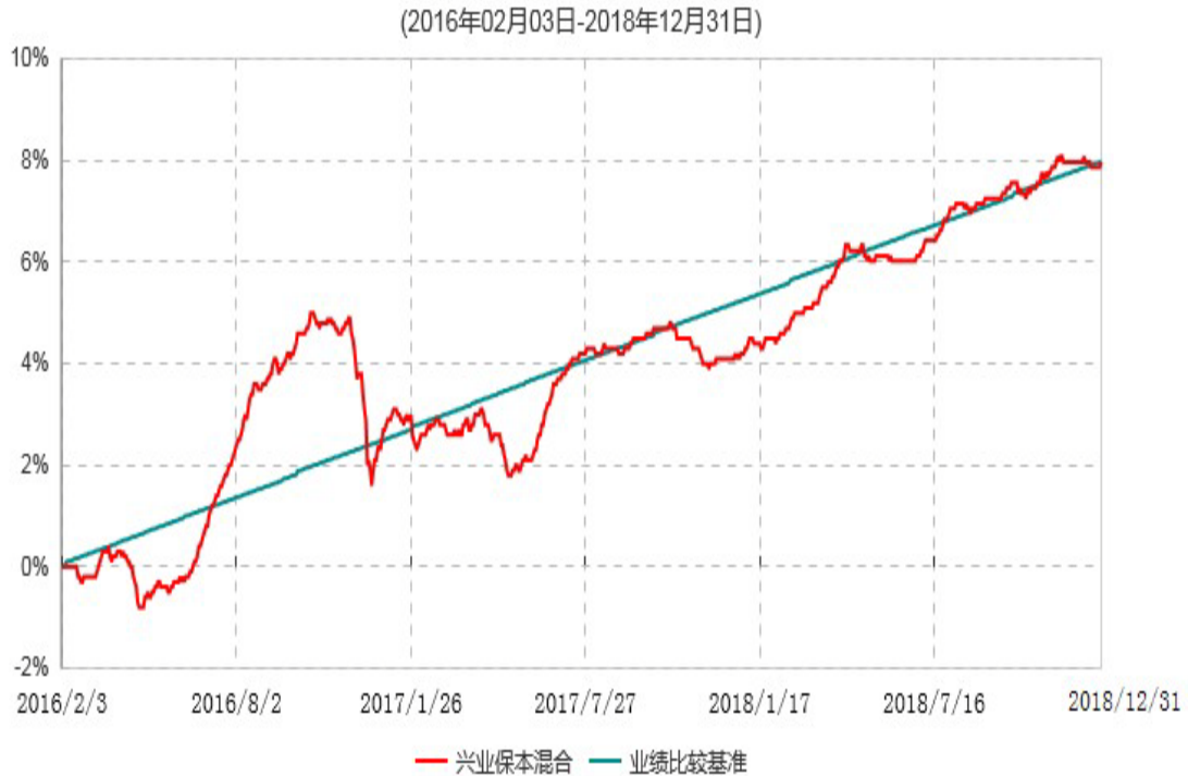
兴业保本混合型证券投资基金累计净值增长率与业绩比较基准收益率历史走势对比图