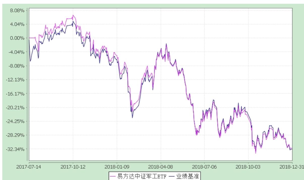
易方达中证军工交易型开放式指数证券投资基金 份额累计净值增长率与业绩比较基准收益率历史走势对比图 (2017年7月14日至2018年12月31日)

注：自基金合同生效至报告期末,基金份额净值增长率为-32.15%,同期业绩比较基准收益率为-32.41%。