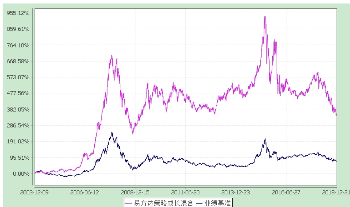
易方达策略成长证券投资基金 份额累计净值增长率与业绩比较基准收益率历史走势对比图 (2003 年 12 月 9 日至 2018 年 12 月 31 日)

注：自基金合同生效至报告期末，基金份额净值增长率为 347.65%，同期业绩比较基准收益率为 73.55%。