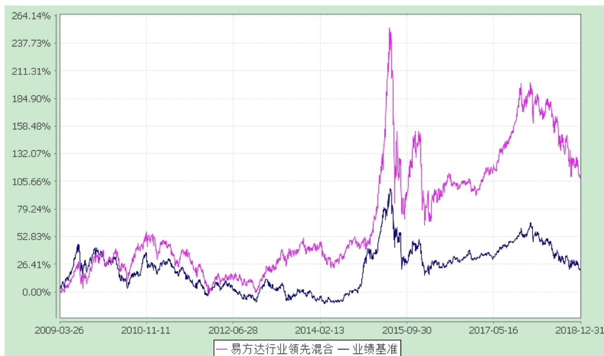
易方达行业领先企业混合型证券投资基金 份额累计净值增长率与业绩比较基准收益率历史走势对比图 (2009 年 3 月 26 日至 2018 年 12 月 31 日)

注：自基金合同生效至报告期末，基金份额净值增长率为 109.70%，同期业绩比较基准收益率为 21.25%。