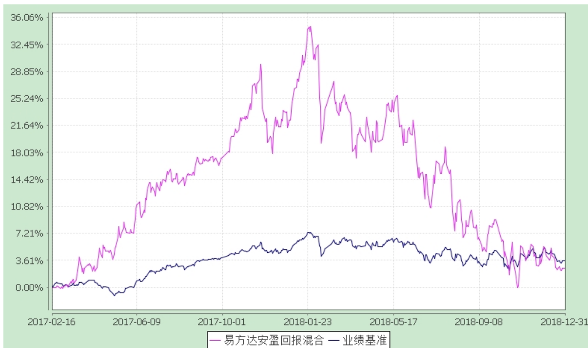
易方达安盈回报混合型证券投资基金 份额累计净值增长率与业绩比较基准收益率历史走势对比图 (2017 年 2 月 16 日至 2018 年 12 月 31 日)

注：自基金合同生效至报告期末，基金份额净值增长率为 2.60%，同期业绩比较基准收益率为 3.57%。