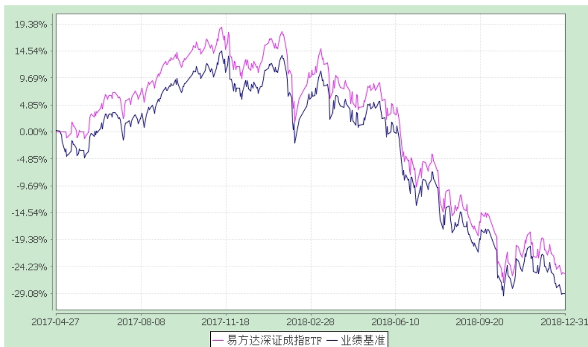
易方达深证成指交易型开放式指数证券投资基金 份额累计净值增长率与业绩比较基准收益率历史走势对比图 (2017 年 4 月 27 日至 2018 年 12 月 31 日)

注：自基金合同生效至报告期末，基金份额净值增长率为-25.47%，同期业绩比较基准收益率为-29.06%。