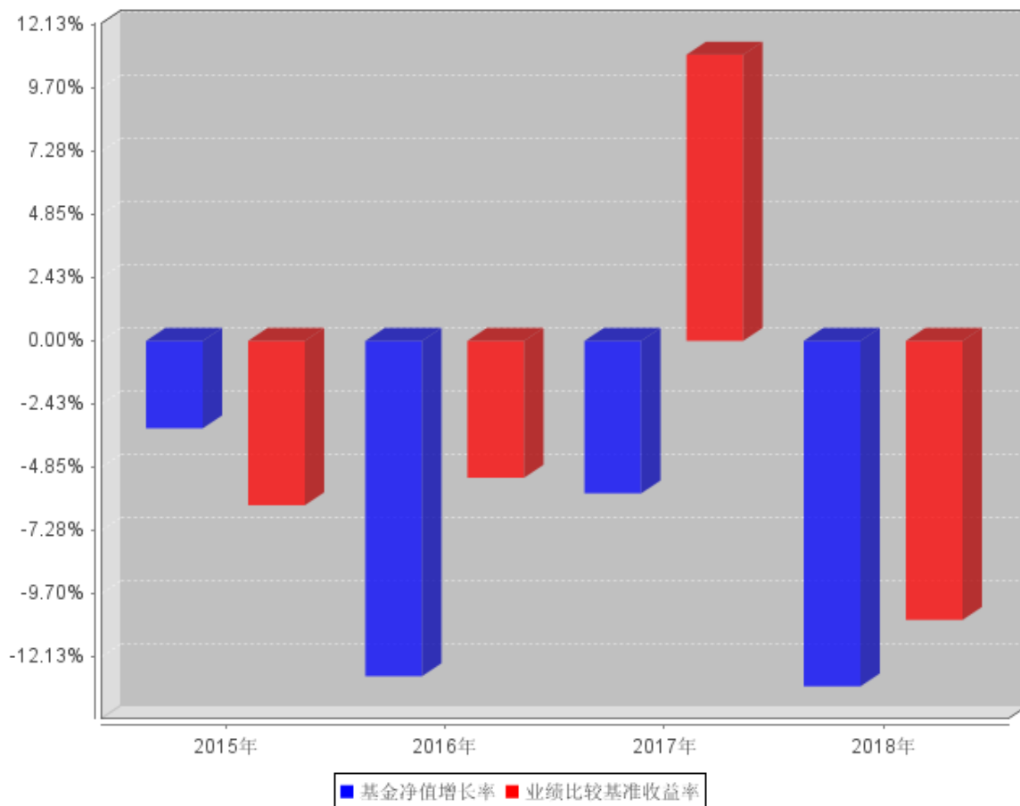
自基金合同生效以来基金每年净值增长率及其与同期业绩比较基准收益率的对比图

注：上图中 2015 年度是指 2015 年 7 月 1 日(基金转型生效日)至 2015 年 12 月 31 日，相关数据未按自然年度进行折算。