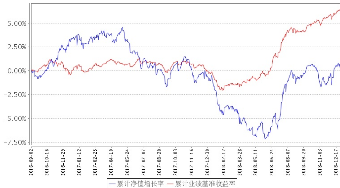
招商信用定开债(QDII)累计净值增长率与同期业绩比较基准收益率的历史走势对比图