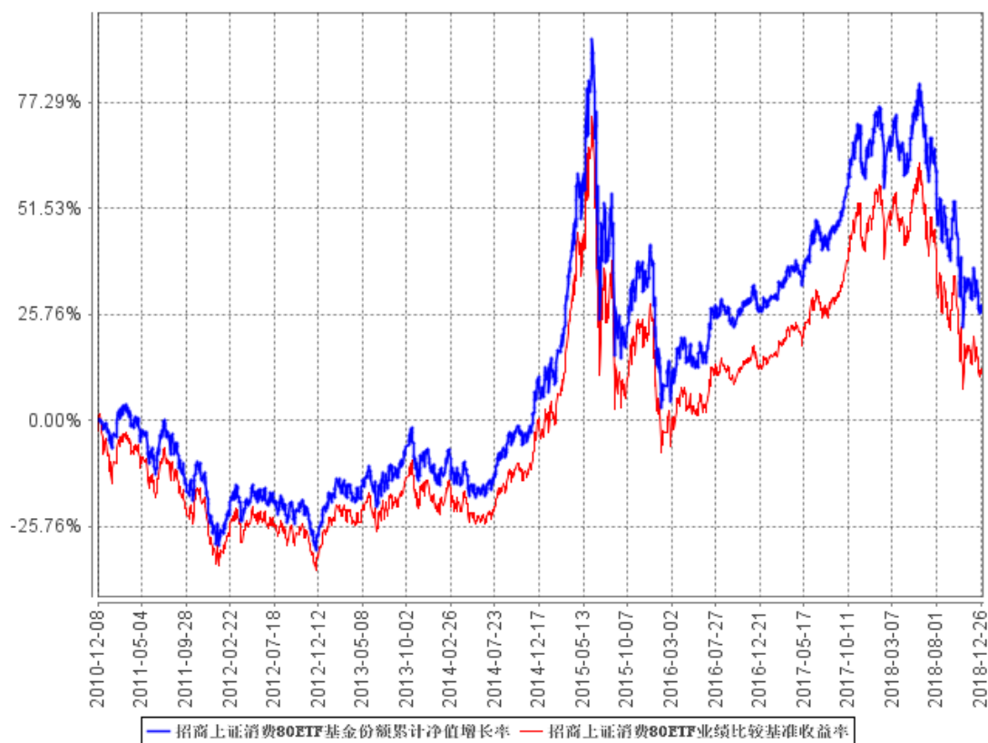
招商上证消费80ETF基金份额累计净值增长率与同期业绩比较基准收益率的历史走势对比图