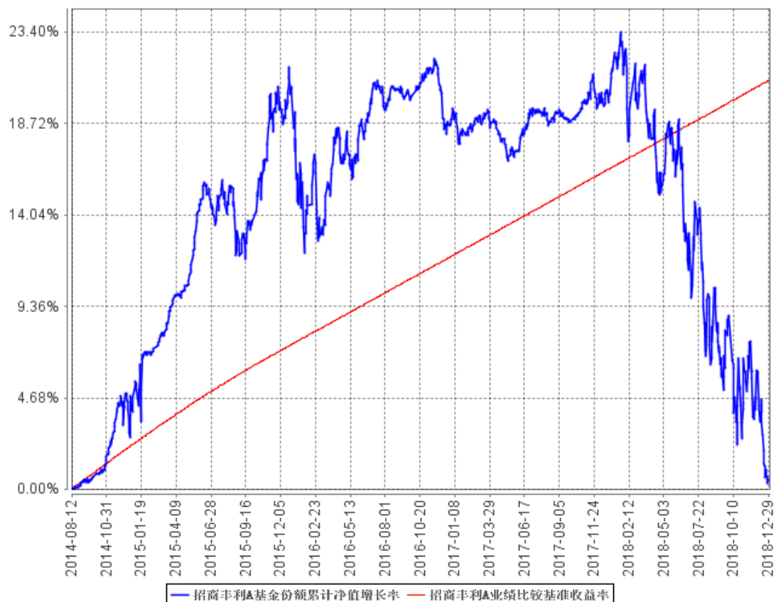
招商丰利A基金份额累计净值增长率与同期业绩比较基准收益率的历史走势对比图