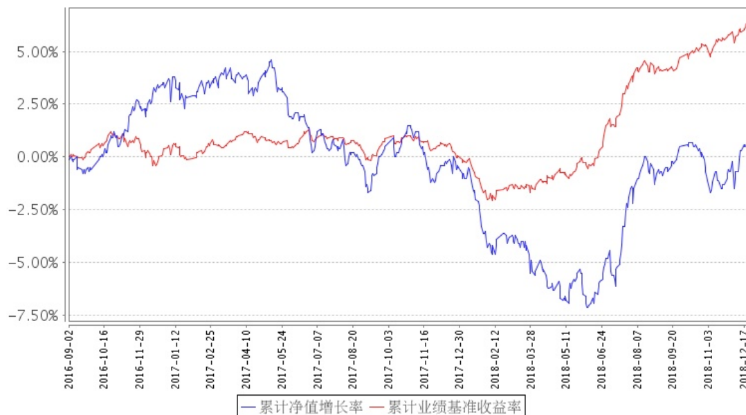
招商信用定开债(QDII)累计净值增长率与同期业绩比较基准收益率的历史走势对比图