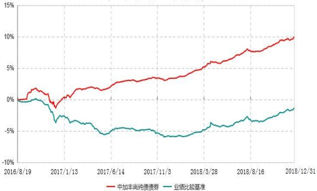
中加丰尚纯债债券型证券投资基金累计净值增长率与业绩比较基准收益率历史走势对比图 (2016年08月19日-2018年12月31日)