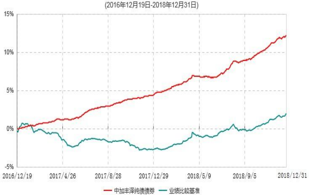
中加丰泽纯债债券型证券投资基金累计净值增长率与业绩比较基准收益率历史走势对比图