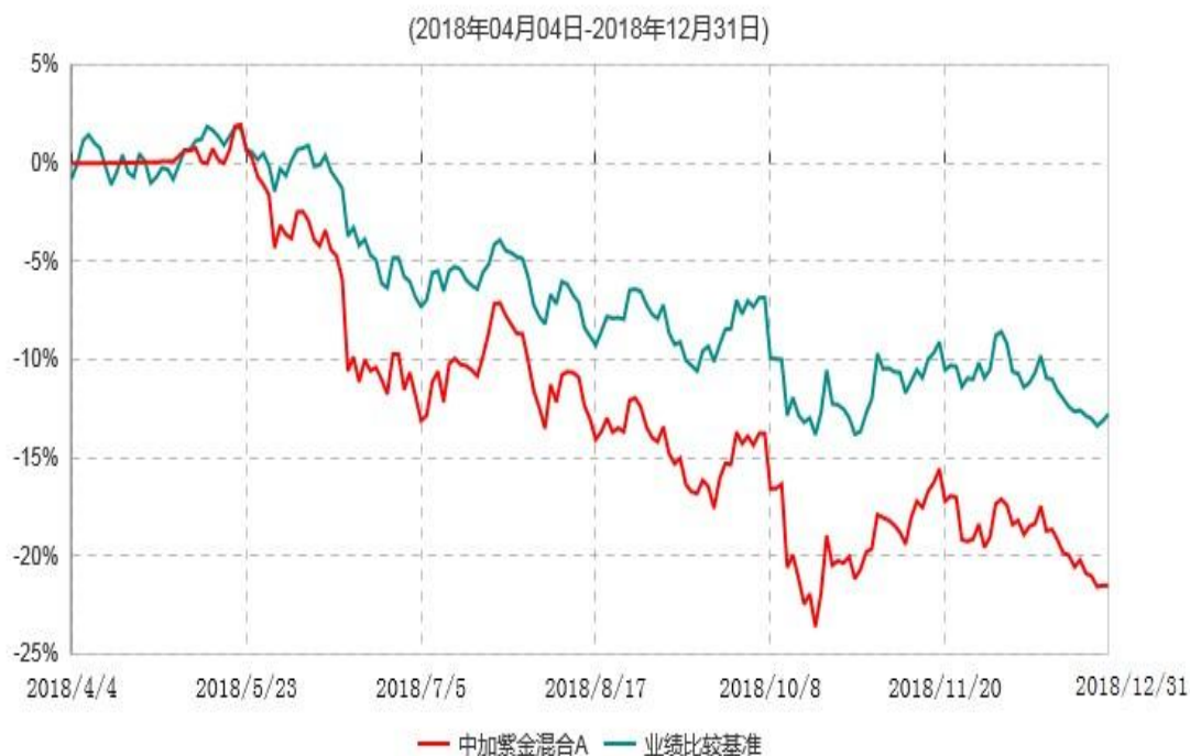
中加紫金混合A累计净值增长率与业绩比较基准收益率历史走势对比图