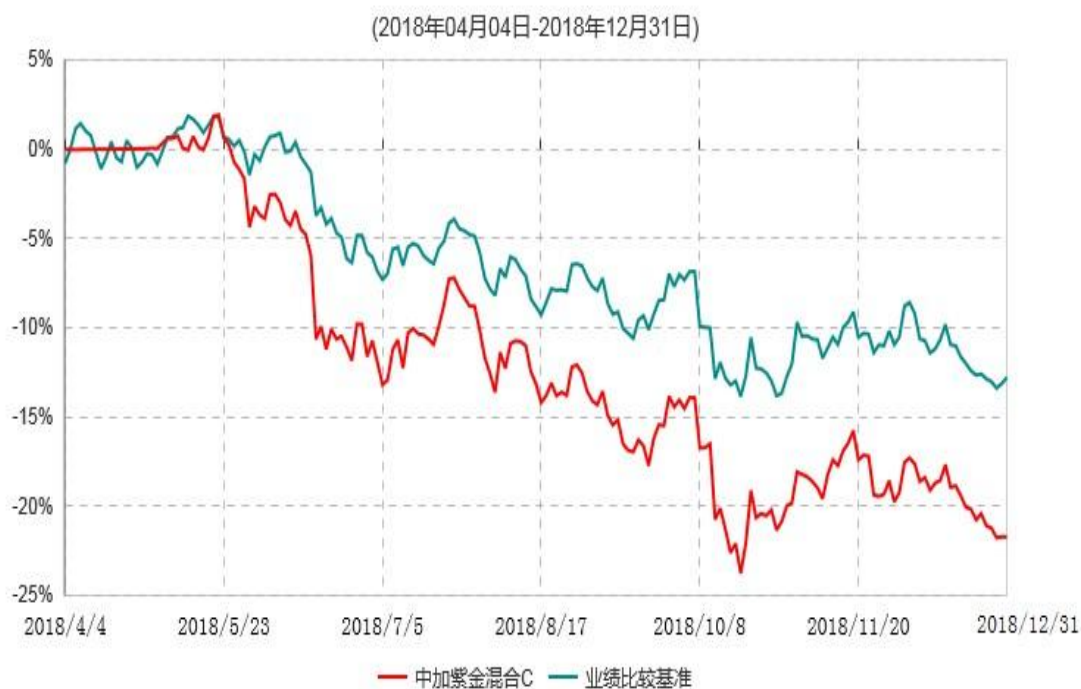
中加紫金混合C累计净值增长率与业绩比较基准收益率历史走势对比图