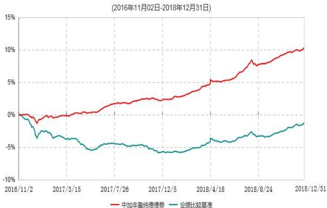
中加丰盈纯债债券型证券投资基金累计净值增长率与业绩比较基准收益率历史走势对比图

注：1、本基金基金合同于2016年11月2日生效，截至本报告期末，本基金合同生效已满一年。