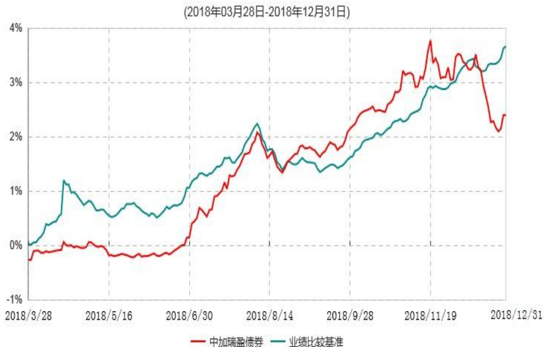
中加瑞盈债券型证券投资基金累计净值增长率与业绩比较基准收益率历史走势对比图

注：1. 本基金转型日为2018年3月28日，截至本报告期末，转型未满一年。 2. 根据转型相关公告和基金合同约定，本基金投资转型期为自转型之日起不超过3个月。投资转型期结束日（2018年6月27日）起次个工作日本基金的各项投资比例符合基金合同有关约定。