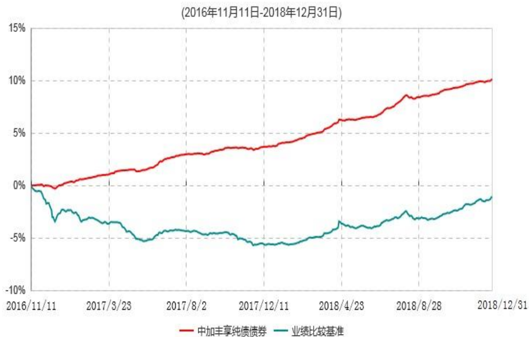
中加丰享纯债债券型证券投资基金累计净值增长率与业绩比较基准收益率历史走势对比图