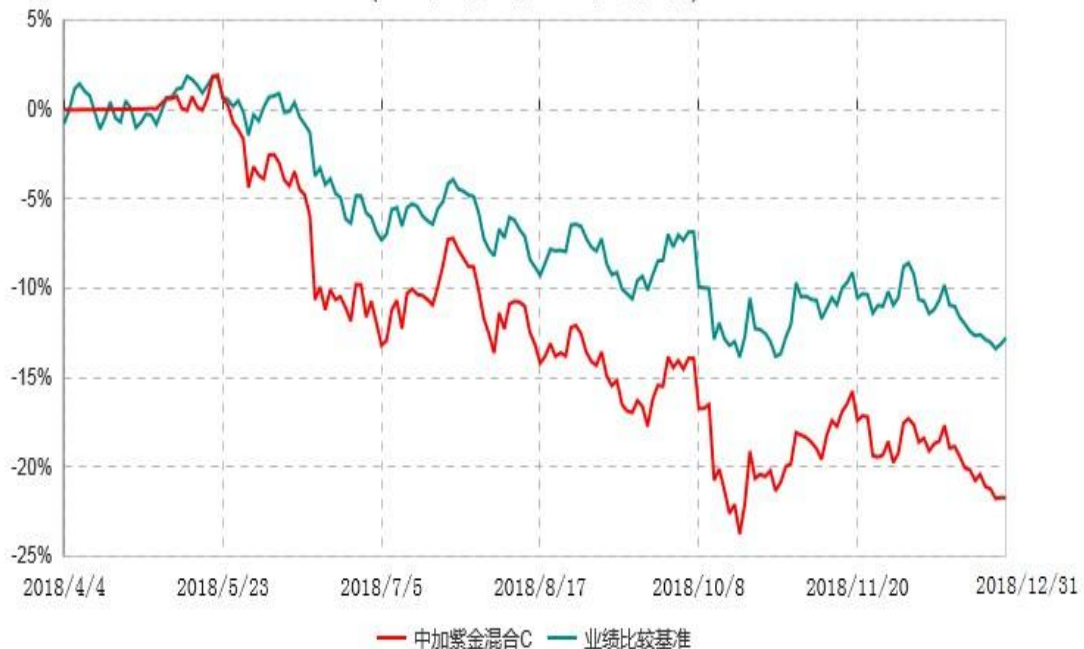
中加紫金混合C累计净值增长率与业绩比较基准收益率历史走势对比图 (2018年04月04日-2018年12月31日)