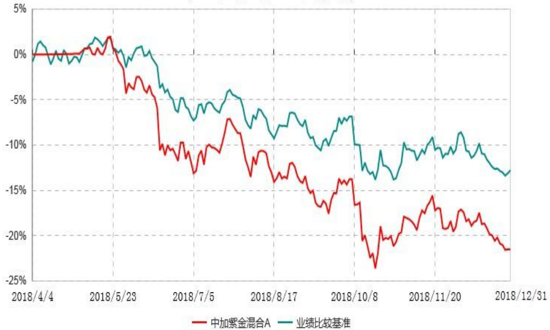
中加紫金混合A累计净值增长率与业绩比较基准收益率历史走势对比图 (2018年04月04日-2018年12月31日)