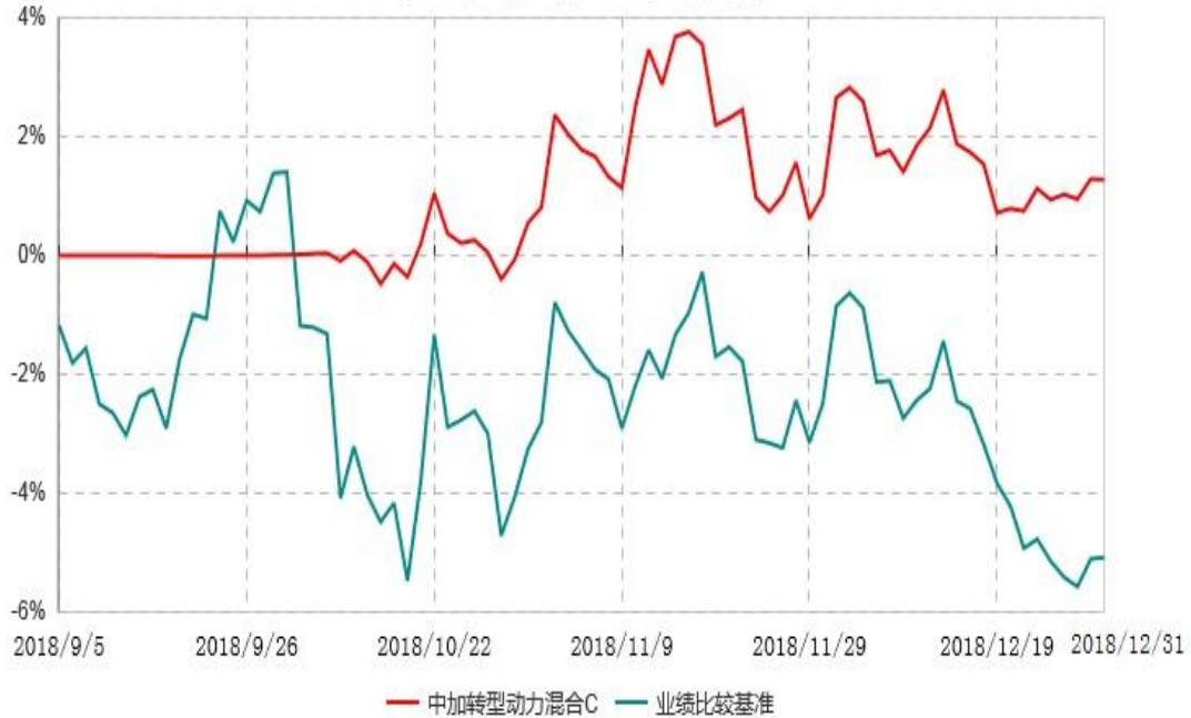
中加转型动力混合C累计净值增长率与业绩比较基准收益率历史走势对比图 (2018年09月05日-2018年12月31日)

注：1. 本基金基金合同于 2018 年 9 月 5 日生效，截至本报告期末，本基金基金合同生效未 满一年。 2. 按基金合同规定，本基金建仓期为 6 个月，截至本报告期末，本基金基金合同生效未 满 6 个月，建仓期尚未结束。