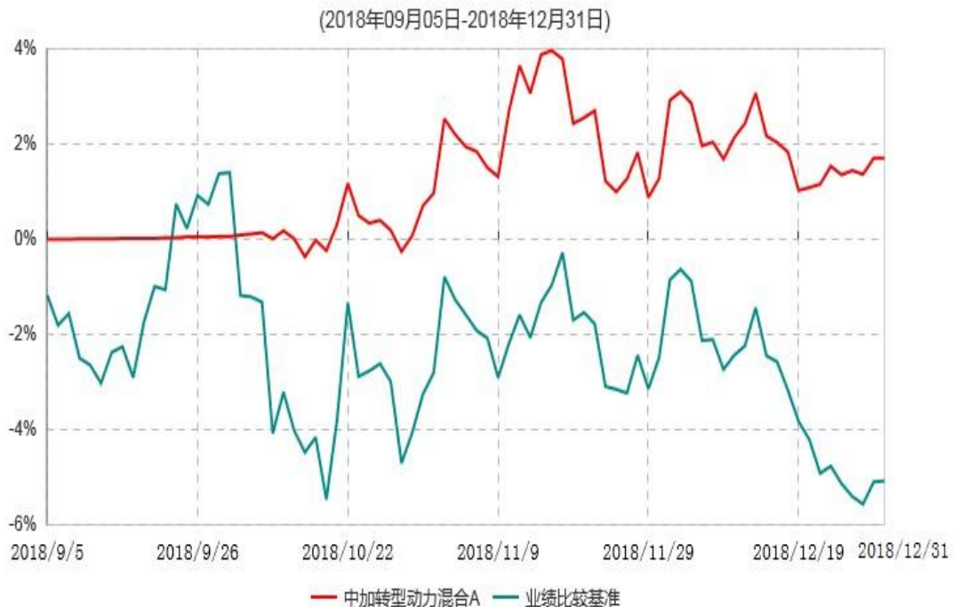
中加转型动力混合A累计净值增长率与业绩比较基准收益率历史走势对比图

注：1. 本基金基金合同于 2018 年 9 月 5 日生效，截至本报告期末，本基金基金合同生效未满一年。