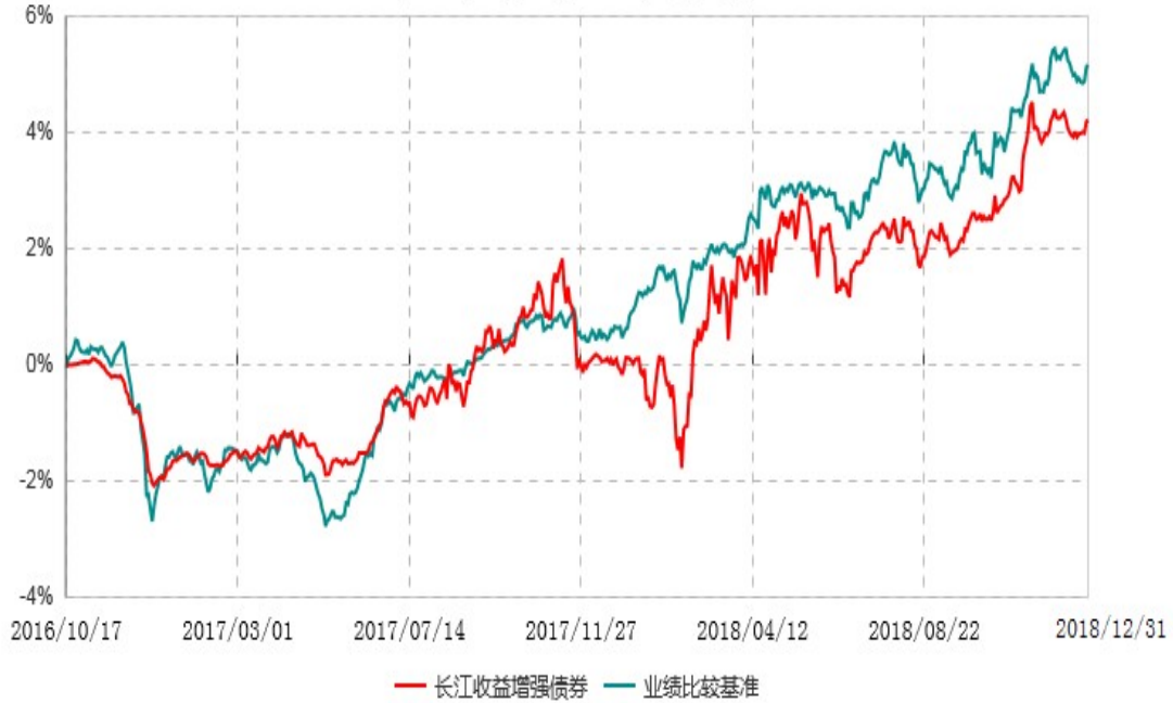
长江收益增强债券型证券投资基金累计净值增长率与业绩比较基准收益率历史走势对比图 (2016年10月17日-2018年12月31日)